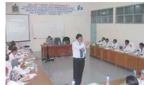
Seminar untuk peningkatan pelayanan pemerintah berdasarkan konsep tata pemerintahan yang baik

Untuk desentralisasi, Indonesia sedang berjuang keras untuk melaksanakan proyek-proyek yang memenuhi kebutuhan daerah dengan lebih baik. Termasuk pengalokasian dana belanja kepada pemerintah daerah, juga termasuk mengalihkan fungsi pemerintah pusat kepada kontrol pemerintah daerah. Dengan demikian penguatan kapabilitas/kemampuan dari pemerintah daerah yang belum banyak memiliki pengalaman dalam mengambil inisiatif dalam membuat perencanaan dan melaksanakan proyek merupakan hal yang sangat dibutuhkan.