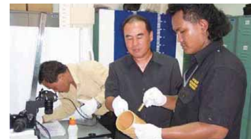
Alih kemampuan dan pengetahuan teknik identifikasi