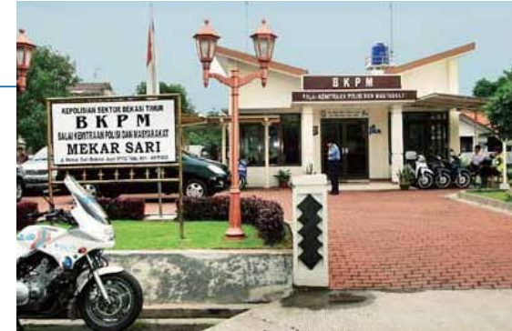
BKPM merupakan adopsi dan pos polisi Jepang ("koban")